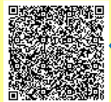
ファミサポの情報はこちらから

申込 東かがわ市ファミリー・サポート・センター ※裏面の連絡先までお申し込みください。