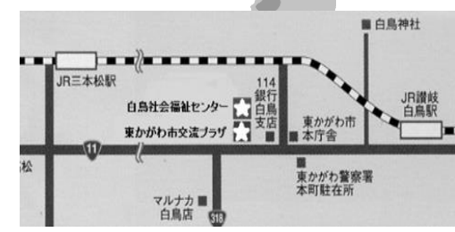
■会場■ 白鳥社会福祉センター (東かがわ市湊 1809 番地)

東かがわ市ファミリー・サポート・センター (東かがわ市社会福祉協議会内) 住所: 東かがわ市湊 1809 番地 TEL: (0879)26-1151 FAX: (0879)26-3016 受付: 月~金 9:00~17:00